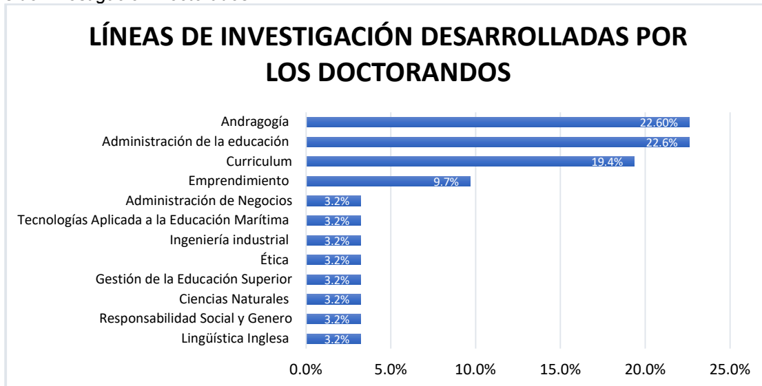
Líneas de investigación Doctorados

Nota: Se evidencia en la gráfica las diferentes líneas de investigación que desarrollan las tesis doctorales los estudiantes encuestados.